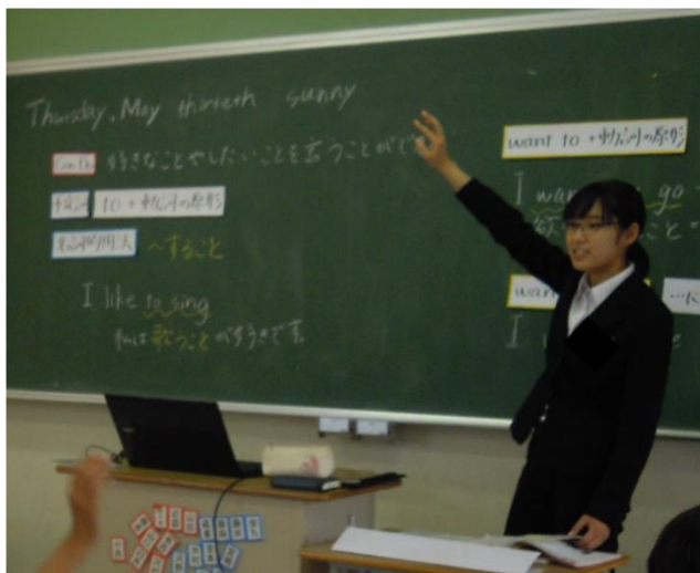
外国語(英語)の授業